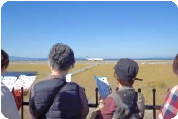
これほどこの国の飛行機・・・?

予定通り10:30に関西空港(KIX)に到着したあと展望ホールに上がり集合写真を撮りました。その後ガイドさんがバスに乗り込み、車窓からの案内で通常は入れない保安区域の見学をしました。給油タンク施設や機内食工場など、最後は第2期人工島にあるメガソーラ施設の見学です。この場所だけバスから降りて展望台に上がり、広大な景色と、滑走路には各国の飛行機が次々と着陸して来ていました。パンフレットを見ながら外国